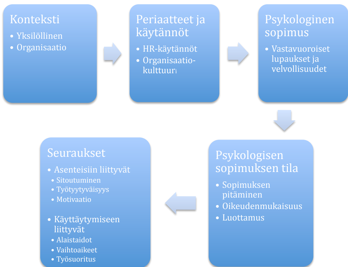
Kuva 2: Viitekehys psykologisen sopimuksen soveltamiselle työsuhteen analysointiin (Guest, 2004: 550).

Konteksti vaikuttaa organisaation käytäntöjen muodostumiseen, esimerkiksi työnantajan ja työntekijän välisiin suhteisiin, organisaatiokulttuuriin sekä henkilöstökäytäntöihin. Näissä puitteissa syntyvät psykologiset sopimukset ja siihen liittyvät vastavuoroiset lupaukset ja velvollisuudet. Sopimuksen noudattaminen ja oikeudenmukaisuus synnyttävät luottamusta, ja niiden kautta psykologisen sopimuksen tila vaikuttaa työntekijän asenteisiin ja käyttäytymiseen. Asenteisiin liittyviä seurauksia ovat esimerkiksi sitoutuminen, työtyytyväisyys ja motivaatio. Nämä vaikuttavat osaltaan käyttäytymiseen liittyviin seurauksiin, kuten alaistaitoihin, vaihtoikeisiin tai työsuoritukseen. (Guest, 2004)